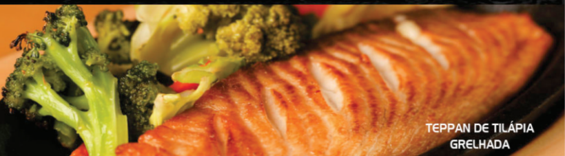
TEPPAN DE TILÁPIA GRELHADA