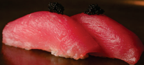
NIGUIRI DE ATUM