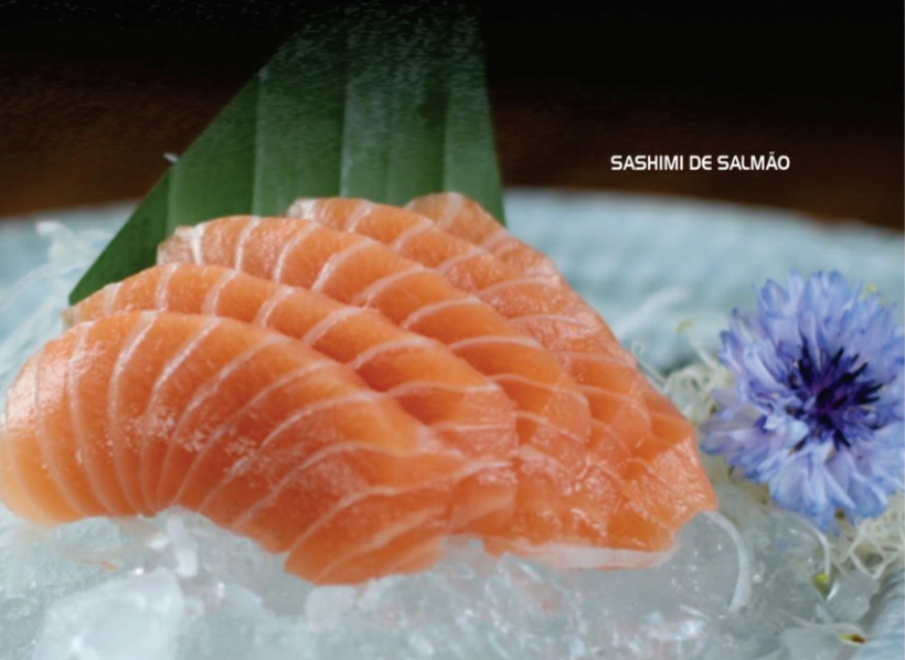
SASHIMI DE SALMÃO