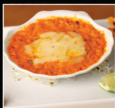
CASQUINHA DE SIRI

E MAIS... YAKISSOBA PASTELZINHO DE SALMÃO