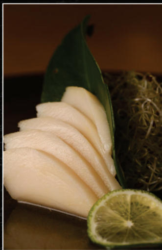
SASHIMI DE PEIXE PREGO