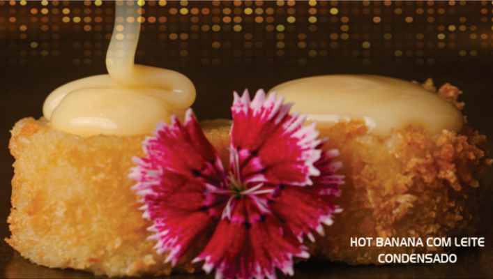
HOT BANANA COM LEITE CONDENSADO