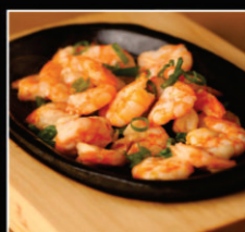
CAMARÃO NA CHAPA