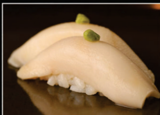
NIGUIRI PEIXE BRANCO