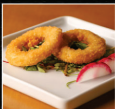
LULA À DORÊ