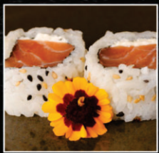
URAMAKI DE SALMÃO