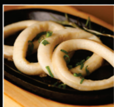
LULA NA CHAPA