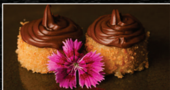
HOT BANANA COM CHOCOLATE