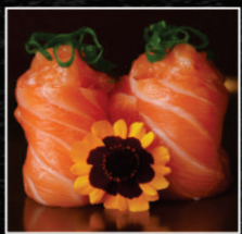
JHOU DE SALMÃO