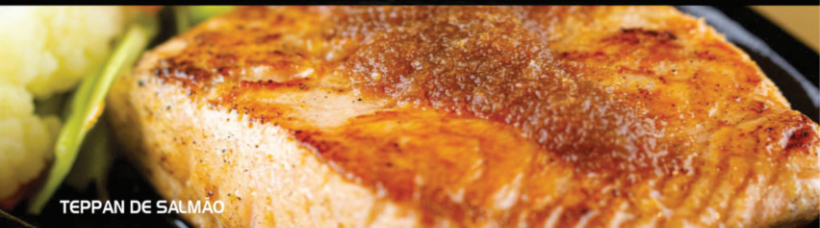
TEPPAN DE SALMÃO