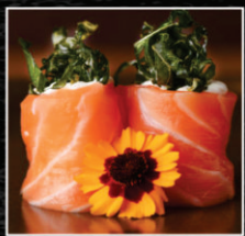
JHOU FLAMBADO COM COUVE