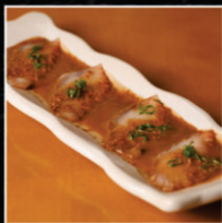
CARPACCIO DE TILÁPIA COM MOLHO DO CHEFE

CARPACCIO DE SALMÃO COM GELÉIA DE PIMENTA