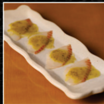
CARPACCIO DE TILÁPIA COM MOLHO DE AZEITONAS