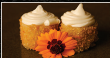
HOT BANANA COM DOCE DE LEITE