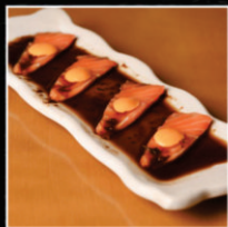
CARPACCIO DE SALMÃO COM MOLHO PONZO E MARACUJÁ