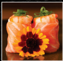
JHOU COM CAMARÃO