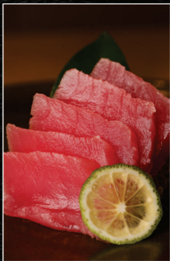
SASHIMI DE ATUM